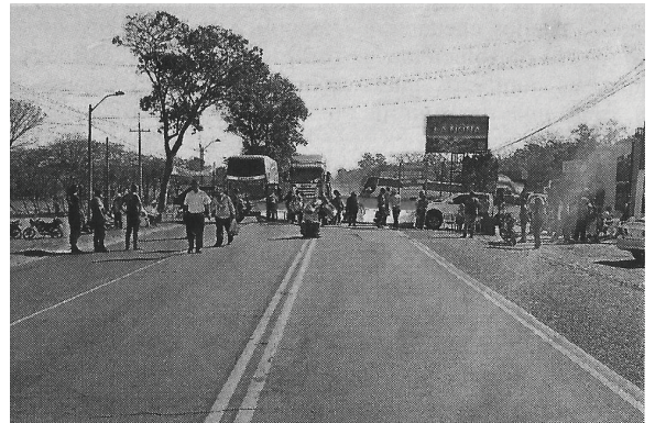
Bloqueo de ruta en Coronel Oviedo en repudio del "acta bilateral" y juicio político al presidente.