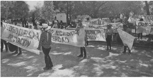
Protesta en el lejano Fuerte Olimpo por la destitución de un intendente organizado en la corrupción. abc 23/07/19