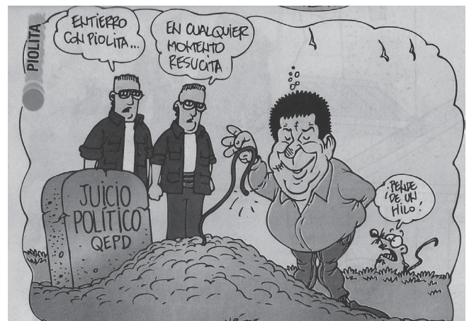
(abc Sección Humor 25/08/19)

El arreglo reciente (en realidad reparto de negocios y de puestos en el gobierno) que Cartes y MAB trataron de completar por el pedido especial de los jefes del Estado brasilero y la insistencia del gobierno de Trump, relacionada ésta con el espionaje y la disminución del Presupuesto General de Gastos (del Estado), que sus jefes (de Trump) de los monopolios financieros le exigen (J. P. Morgan, etc.); no llegó a concretarse como un acuerdo compacto, sino como un arreglo que empezó antes de las elecciones, “punto por punto” “entre gallos y medianoche”, la tirantez interminable entre unos y otros grupos de aprovechadores del Estado, colorados y liberales “cartistas”, se mantiene ahora detrás de áreas de negocios puntuales ( energía , obras de construcción grandes, salud pública, educación, tierras, etc.) Este arreglo enclenque le dio fuerza especial al dominio que Cartes y su entorno ejercen sobre el gobierno actual, en particular respecto de proteger a Abdo Benítez, Velázquez y otros de una caída por juicio político al gobierno. La “ayuda” de Cartes fue una exigencia de gobierno norteamericano (a costa de no llevarlo (a Cartes) extraditado de inmediato al Brasil o a Estados Unidos, y aprovechada por éste para doblegar por completo al débil MAB.