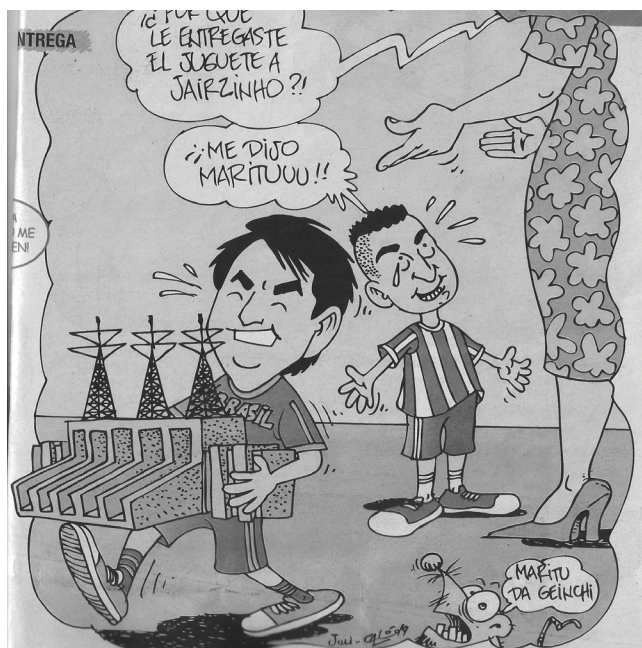
abc Sección Humor 25/08/19)