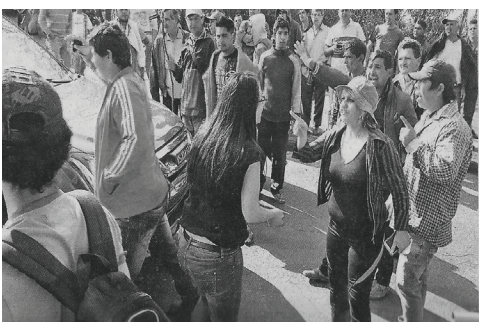
Tomateros de Coronel Oviedo cerrando la ruta. Exigen 3.500 gs. el Kg.

Folleto de la organización popular ñane mba'e en lucha contra el tratado de Itaipu. Organiza conferencias y reuniones para explicar las consecuencias del tratado firmado por el general Stroessner y el general Garrastazú del Brasil en el año 1973. La pérdida de la soberanía territorial del Paraguay y la constante dominación brasilera a través de una "Binacional" en territorio brasilero.