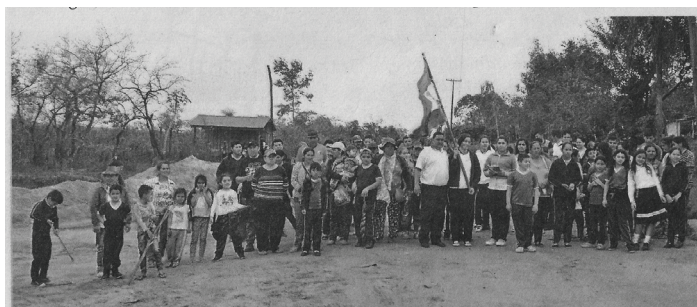
En Yataity del Norte alumnos protestan por aulas y almuerzo