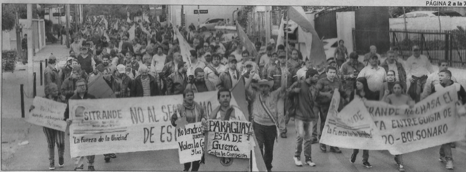
Resistencia. El malestar ciudadano y la movilización de grupos, como el de Sitrande (foto), torcieron la mano al Gobierno.

Movilización organizada por el sindicato de la ANDE (SITRANDE)