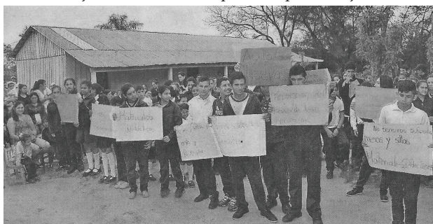
Alumnos de la escuela Pirí Pucu de San Pedro de Ycuamandiyu se movilizan por el arreglo de caminos.