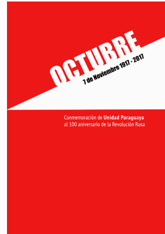
Edición especial por el 100° aniversario de la Revolución Rusa del 7 de noviembre de 1917

¡Adelante camaradas! ¡A ayudar a nuestro pueblo A organizarse más y mejor En el curso de sus propias experiencias!