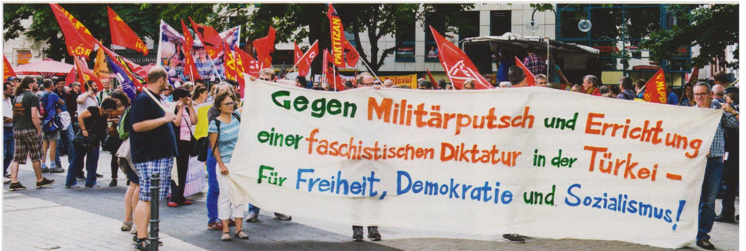
Türkiye’de kurulan faşist diktatörlüğe ve Merkel hükümetinin Erdoğan’a destek vermesine karşı eylemlerden biri: Enternasyonalist ittifakın ortaklaşa yaptığı gösteri yürüyüşü

GABI GÄRTNER: 23 Temmuz’da yapılan ittifak toplantısında, 2 Ekim’de seçim kongresi yapılmasına karar veril-