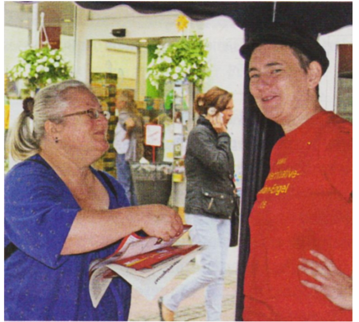
İnsanları siyasi alanda aktif olmaya yönlendirmek istiyoruz

Mutlak egemenliğe sahip uluslararası mali-sermayenin ve