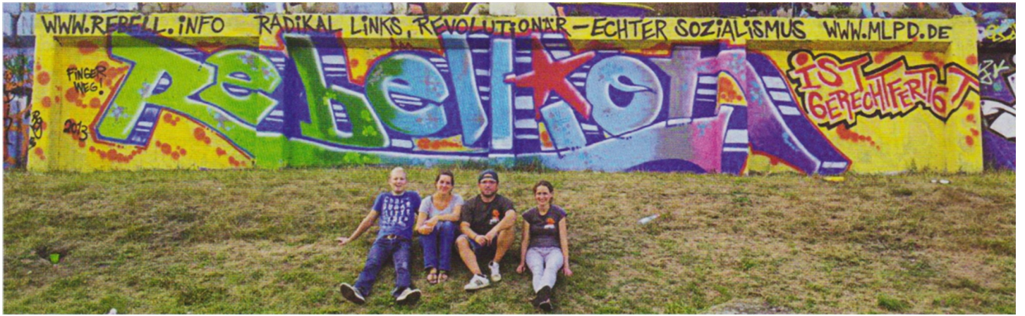
MLPD ile Rebell, kendi profillerini gösteriyor – ve ittifakın inşası için tam sorumluluk üstleniyorlar (Fotoğraf 2013 yılında çekildi)

Proje geleceğe yöneliktir; başarılı geçmesini dileriz!