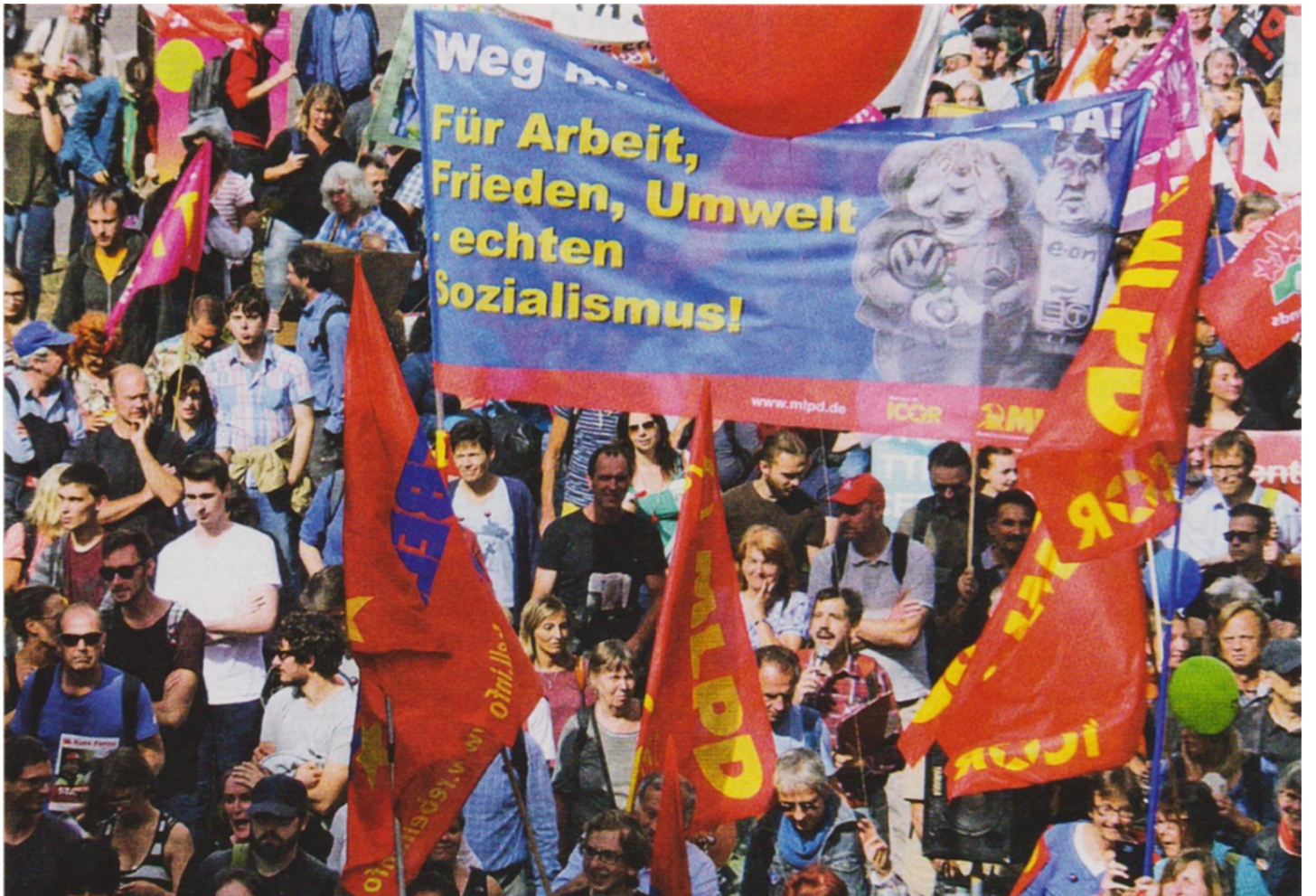
Bizi kim ararsa, bizi toplumsal alternatif olarak bulabilmelidir

GABI GÄRTNER: Elbette ki, aralarında Sol Parti olmak üzere küçük burjuva solu taktik atılımımızın başdüşmanı değildir. Biz, Sol Parti veya DKP'nin bütün üyelerine ve ya diğer solculara mücadele temelinde birlikte çalışmaya açığız. Ne var ki sol partinin yönetimi ve üyelerinin büyük bir kısmı, parlamento etkinlikleriyle sınırlı reformist bir yol izlemektedir. Sol Parti haklı olarak şu ya bu haksızlığı eleştirmektedir ama – sonra ne yapar? "Sosyal piyasa ekonomisi" veya "Sosyal devlet"le ilgili hayalleri yine canlandırmaya çalışıyor. Gerçek şu ki bu tür yaşam yalanlarının yeri kapitalizmin çöp kutusu olmalıdır. Bilen burjuva partileri bu tür yaşam yalanlarından söz et-