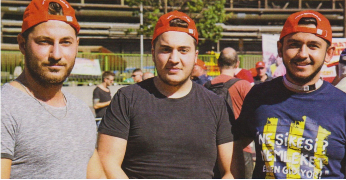
Kitleler arasında devam eden ilerici ruh hali değişikliğinin bir ifadesi: 31 Ağustos 2016 tarihinde düzenlenen Çelik İşçileri Eylem Gününe ("Stahlaktionstag") 9000 kişi katıldı, gençler de en önde idi

kinda hiçbir şey bilmemektedir. Yani söz konusu olan, proleter enternasyonalizm ruhuyla hükümetin sağa kaymasına karşı daha sıkı işbirliği geliştirmektir.