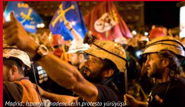
Madrid: İspanyol madencilerin protesto yürüyüşü

Hesap sahibi: MLPD · Banka adı: Deutsche Bank Essen Hesap numarası: 0210333101 · Banka kodu: 36070024 Gönderici notu: „Internationales Europaseminar“