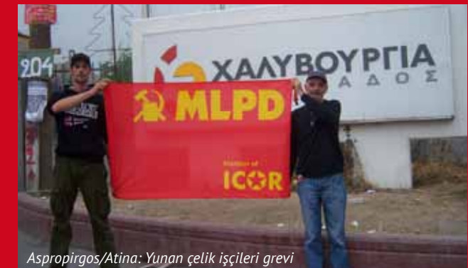
Aspropirgos/Atina: Yunan çelik işçileri grevi