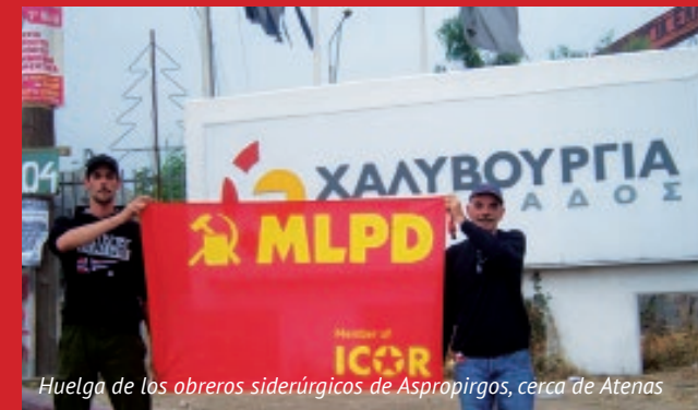
Huelga de los obreros siderúrgicos de Aspropirgos, cerca de Atenas