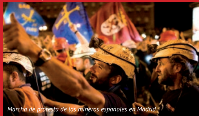
Marcha de protesta de los mineros españoles en Madrid

Cuenta bancaria para donativos: MLPD, Deutsche Bank Essen Número de cuenta: 210333101 · IBAN: DE12 36070024 Razón del pago: Seminario internacional de Europa