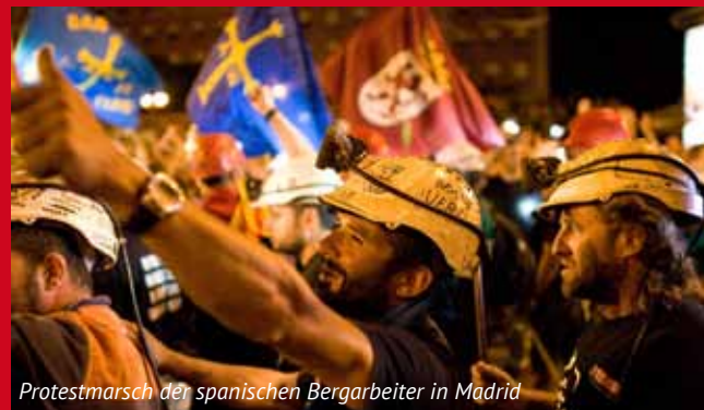
Protestmarsch der spanischen Bergarbeiter in Madrid

Spendenkonto: MLPD, Deutsche Bank Essen Kontonummer: 210333101 · BLZ 36070024 Verwendungszweck: Internationales Europaseminar