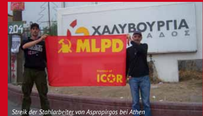
Streik der Stahlarbeiter von Aspropirgos bei Athen