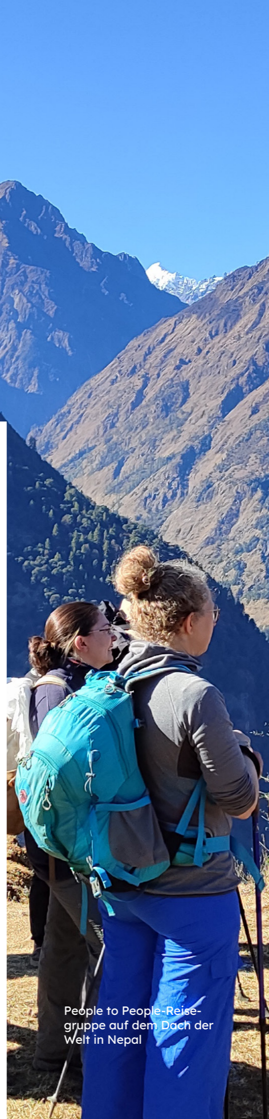
People to People-Reisegruppe auf dem Dach der Welt in Nepal

Tel.: 02091776 560, E-Mail: reisen@people-to-people.de