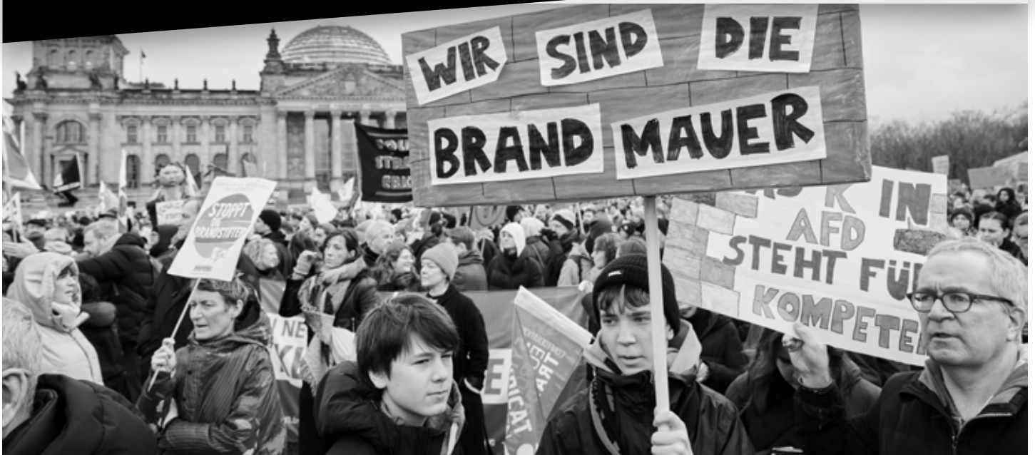
Massenhaft neu belebt: „Wir sind die Brandmauer“ (Demonstration in Berlin vom Januar 2024)

Faschistische Gefahr verschärft sich akut – Millionenfache Brandmauer muss gestärkt werden!