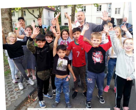
Stefan kann auch Kinderherzen rühren