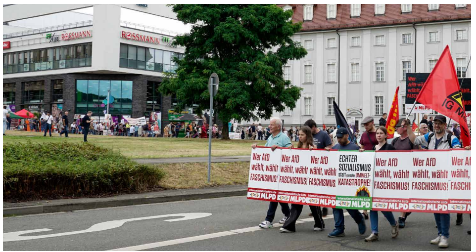
Auftaktdemonstration zum Landtagswahlkampf der Internationalistischen Liste / MLPD in Gera am 27. Juli