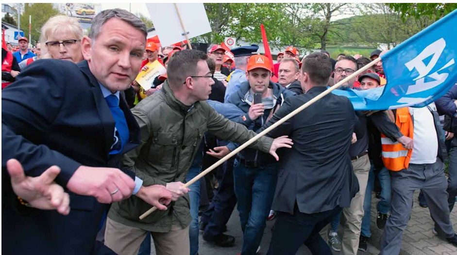
Opel-Kollegen aus Eisenach verjagten Höcke aus ihrer Kundgebung, als er sich einschleichen wollte (2018)

1 EURO FÜR DIE KAMPAGNE: WER AfD WÄHLT, WÄHLT FASCHISMUS