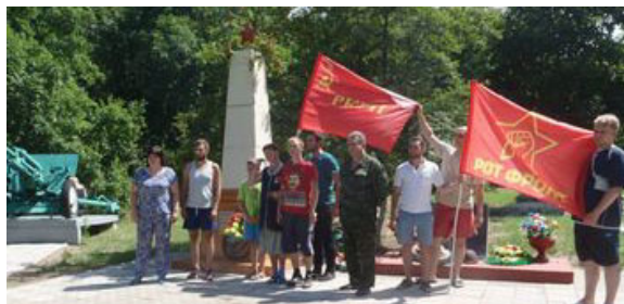
Лагерь 2019-го года. На экскурсии

• Воронежская организация РКРП-КПСС в 4 раз проводит летний коммунистический лагерь в с. Сторожево-1 Воронежской области.